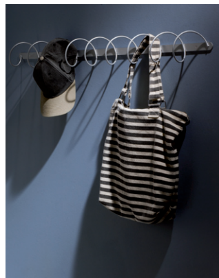
Perchero «Tempo», para MiSCeL-LàNia