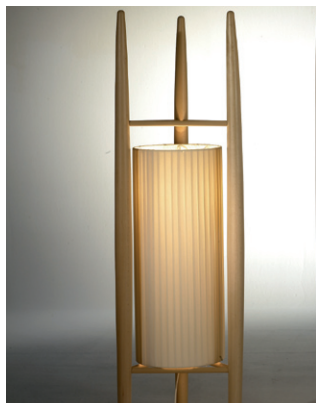
Lámpara «Kyoto», producida por Ona